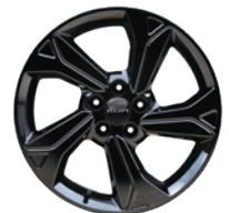
18인치 블랙 다이아몬드 컷팅 휠