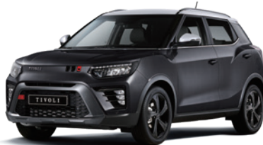
바디컬러 스페이스 블랙 2LA 루프/리어 스포일러/아웃사이드 미러 화이트

* 투톤 익스테리어 패키지는 V3 트림에서 선택 가능 * 투톤 익스테리어 패키지 적용 시 세이프티 선루프 적용 불가 * 블랙 루프 선택 시 아웃사이드 미러 컬러는 바디컬러가 적용되며, 화이트 루프 선택 시 아웃사이드 미러 컬러는 화이트가 적용됨 * 본 가격표에 수록된 제품의 색상은 인쇄된 것이므로 실제 색상과 다소 차이가 있을 수 있습니다.