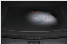
LPG 도넛 탱크 검증된 안전성의 LPG전용 도넛 탱크(58ℓ)