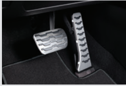
스포츠 페달 60,000원