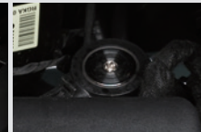
전자식 기화기 액체형태의 LPG가스를 기체상태로 변환하는 전자식 장치