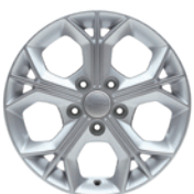
16인치 알로이 휠