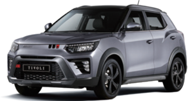
바디컬러/아웃사이드 미러 아이언 메탈 2DE 루프/리어 스포일러 블랙