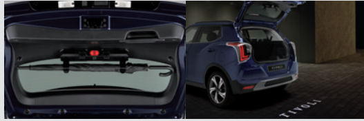
멀티 우산꽂이(우산꽂이 + 비상등 + 테일게이트 스팟램프) 150,000원