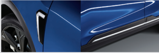
휠더 & 도어 가니쉬 270,000원