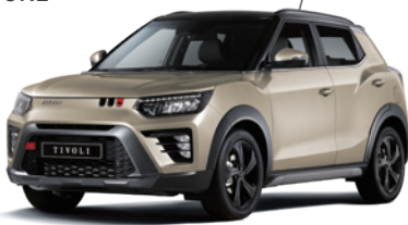
바디컬러/아웃사이드 미러 라떼 그레이지 2BL 루프/리어 스포일러 블랙