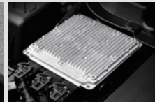
LPG ECU LPG전용 ECU로서 가솔린 ECU와 협업하여 2개 연료를 최적화