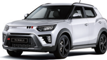
그랜드 화이트 WAA