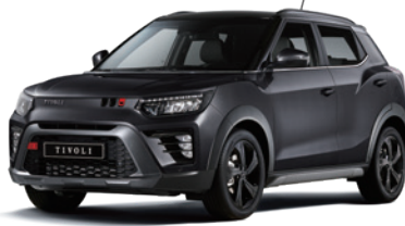
스페이스 블랙 LAK