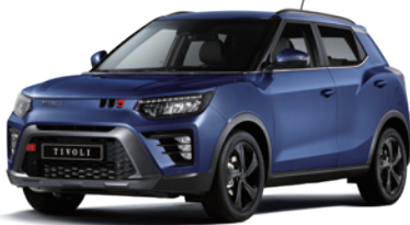
덴디 블루 BAS