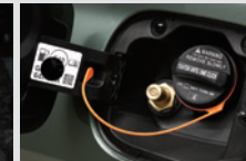
LPG 주입구 가솔린과 LPG 연료를 구분할 수 있도록 주유구를 이원화