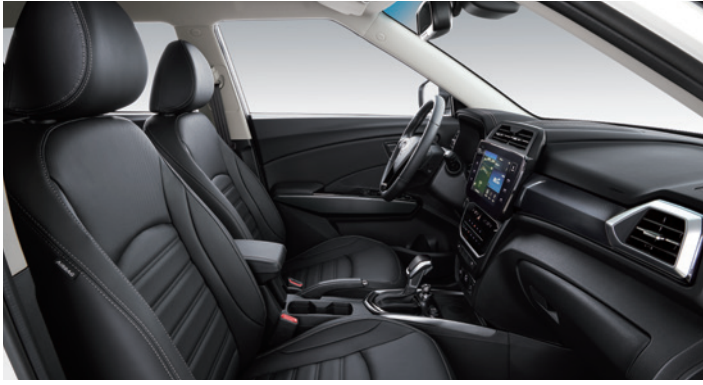
블랙 인테리어(헤드라이닝 : 그레이)