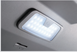
테일게이트 LED 램프 120,000원