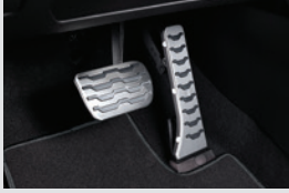
스포츠 페달 60,000원