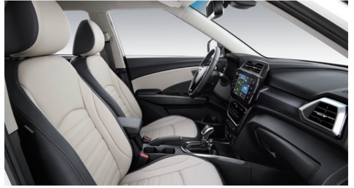
그레이 투톤 인테리어(헤드라이닝 : 그레이)