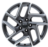
17인치 다이아몬드 컷팅 휠