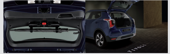
멀티 우산꽂이(우산꽂이 + 비상등 + 테일게이트 스팟램프) 150,000원