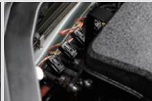
LPG 인젝터 엔진 인젝터에 LPG를 분사하는 장치