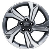
18인치 다이아몬드 컷팅 휠