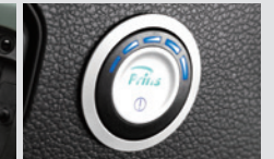
LPG 스위치 LPG 충전량 표시 및 LPG와 가솔린 전환