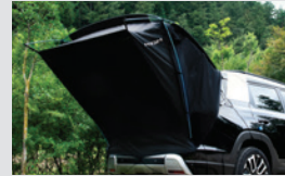
차박용 텐트 380,000원

* 상기 품목은 취급 설명서 내 커스터마이징 품목 보증서에 따라 보증 적용됩니다.