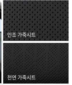
블랙 인테리어 (헤드라이닝 : 블랙)