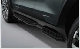
사이드 스텝(좌/우) 450,000원