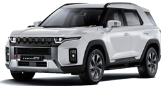
그랜드 화이트 WAA