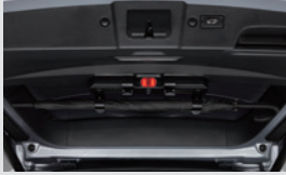
멀티 우산꽃이(우산꽃이 + 비상등 + 테일게이트 스포램프) 150,000원