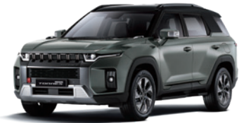
포레스트 그린 2GO

* 루프 / 스포일러 / C필러 : 블랙 컬러(LAE) * 투톤 선택 시 파노라마 선루프 선택 불가 * 본 가격표에 수록된 제품의 색상은 인쇄된 것이므로 실제 색상과 다소 차이가 있을 수 있습니다.