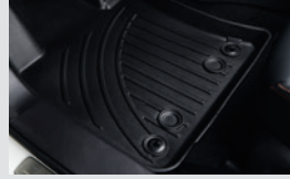
3D TPV 매트 (1열/2열) 150,000원