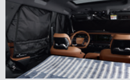
멀티 커튼 100,000원