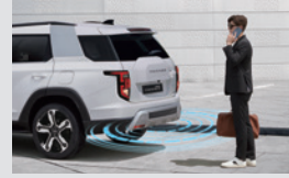
후진 경고음 시스템(AVAS) 120,000원