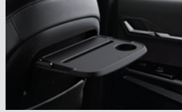
시트백 테이블 300,000원