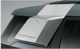
사이드 스토리지 박스(원톤/투톤) 300,000원