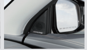
알파인 오디오 시스템 620,000원