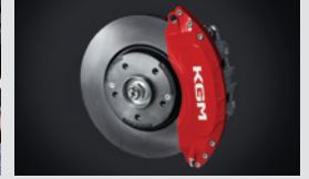
레드 알루미늄 캘리퍼 커버 300,000원