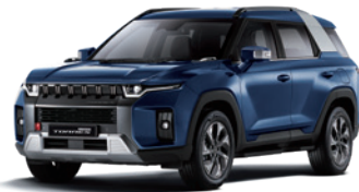
덴디 블루 BAS