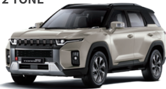
라페 그레이지 2BL