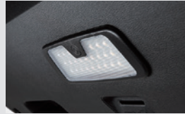
테일게이트 LED 램프 120,000원