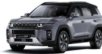
아이언 메탈 2DE