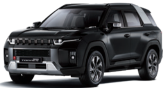
스페이스 블랙 LAK