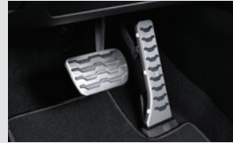
스포츠 페달 60,000원