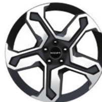
20인치 다이아몬드 커팅 휠