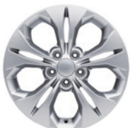
17인치 알루미늄 휠