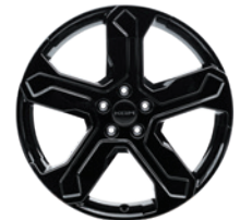
20인치 블랙 다이아몬드 커팅 휠