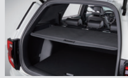
라기지 스크린 90,000원