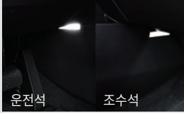
1열 풋램프 & LED 글로브 박스 램프 50,000원